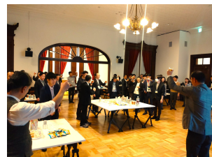
交流会(北海道庁赤れんが庁舎)