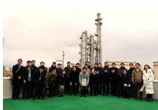
苫小牧CCS実証試験センター